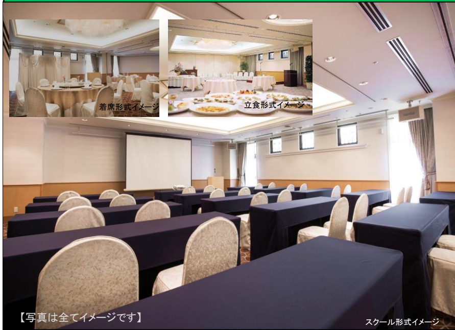
【写真は全てイメージです】